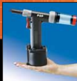
Ligera y cómoda Operación