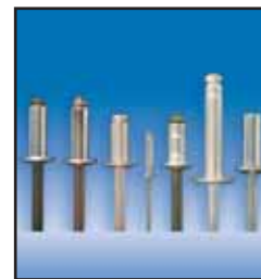
RemachePOP® Exija el Original