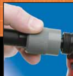
Nariz con Desconexión Rápida