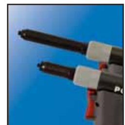
Nariz Extendida de 5"

(*) Usar el Empujador de mordazas FAN239-176 (†) Excluye MultiGrip; (‡) Ajustar Presión de aire a 90 psi (6.2 bar).