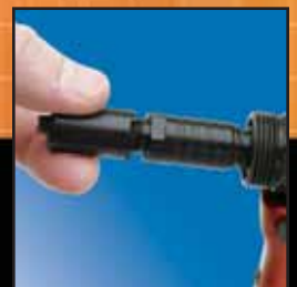
Caja de Mordazas con Desconexión Rápida